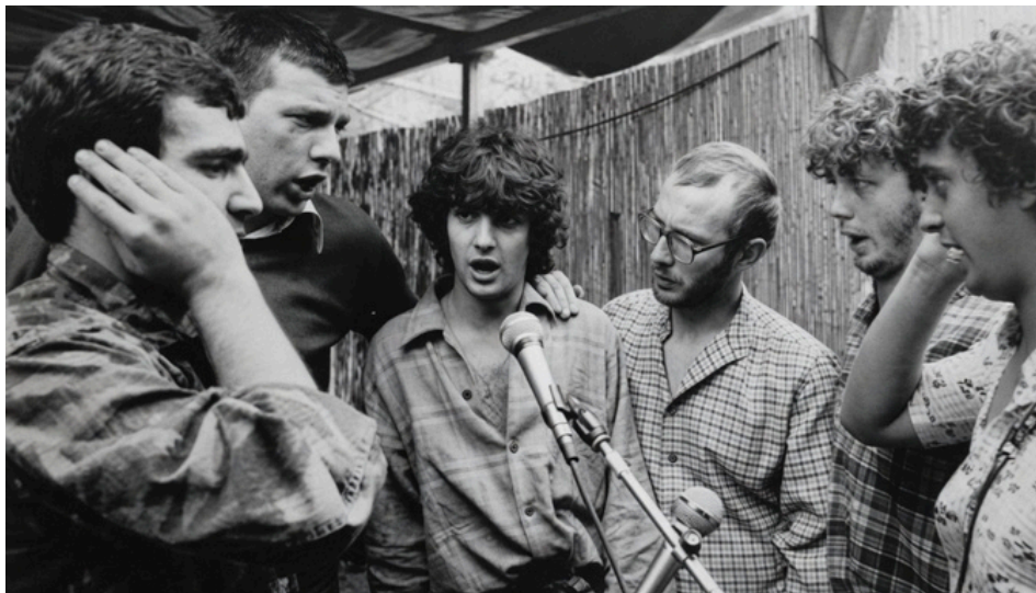
Santa di u Niolu - 1979

On constate en effet, à l'heure actuelle, que « chanter corse » est principalement une affaire d'interprétation, un spectacle redondant où les mêmes chansons sont jouées, peu importe l'heure, l'endroit, ou même les chanteurs. Parfois pour l'argent, parfois pour la gloire, mais trop rarement pour la beauté de la chose. Trop peu cherchent à saisir l'essence de ce qu'ils chantent, ou renoncent même à faire l'effort de comprendre les seules paroles qu'ils déclament.