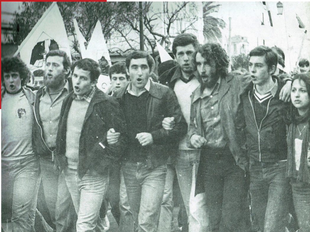
Dumenicu Tavera RC Unita Naziunale - 26 janvier 1980 Manifestation Bastelica Fesch

Pourtant, une autre voie est toujours possible. Et dans la continuité de ce qui fera la Corse de demain, elle est avant tout une prise de conscience nécessaire. Car au fond, qu'est-ce qui unifie dans la musique ? Chanter, comme toutes les formes d'art, est avant tout un moyen d'exprimer ce que l'on est et ce que l'on a à offrir. Et nombreux aujourd'hui sont ceux liés par cette passion commune, désireux de faire entendre leurs voix. C'est à eux qu'il appartient d'être les héritiers de cette longue tradition : qu'ils se réunissent, qu'ils écrivent, qu'ils composent ! Car c'est bien de ces petites initiatives que sont nées les formations les plus iconiques du chant corse, et avec la volonté de faire, le meilleur reste encore à venir. Que chaque artiste redevienne le reflet d'une jeunesse insulaire qui chante qu'elle existe, qui tourne son regard vers l'avenir. Que tous apportent leur vision singulière, qu'ils créent, qu'ils innovent, et qu'ils montrent que cette culture si riche vaut plus qu'un folklore stagnant : qu'elle vive, et qu'elle porte avec elle l'espoir que nous nous devons de transmettre, comme il nous a été transmis.